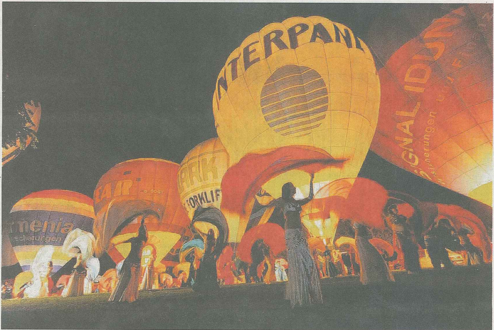
Bauchtänzerinnen in selbstgenähten Kostümen begleiteten das Vorglühen der Ballone und tanzten zu orientalischer Musik.